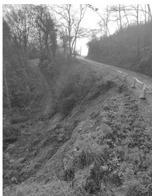
Fotografía 2: Vista da rotura en sentido Crende-Martín