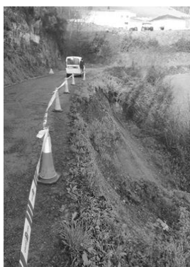
Fotografía 1: Vista da rotura en sentido Martín-Crende

Á vista da situación descrita e polo manifesto risco que supón para os usuarios da vía, procedeuse, ao balizamento da marxe afectada, estreitando a calzada para evitar que os vehículos circulen sobre a zona máis danada. Con todo, de non actuar con rapidez, é probable que se produza unha nova rotura que afecte a parte da calzada.