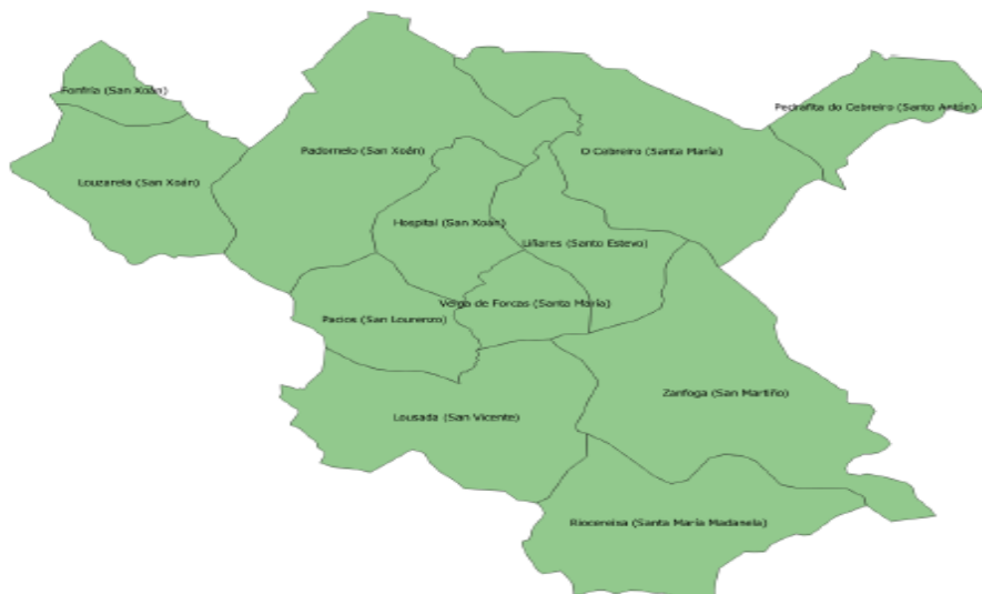
Mapa 2 Mapa de parroquias